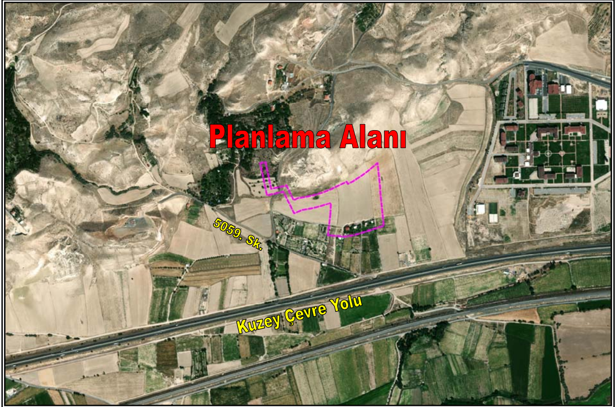
Resim 1: Planlama Alanının Konumu

Planlama alanı; düz bir arazi yapısına sahiptir. Bahse konu alan üzerinde herhangi bir yapılaşma görülmemiş olup boş arazi statüsündedir. Planlama alanının yakın çevresinde ise 1-2 katlı konut kullanımlı yapılar, tarım arazileri ve boş araziler yer almaktadır.